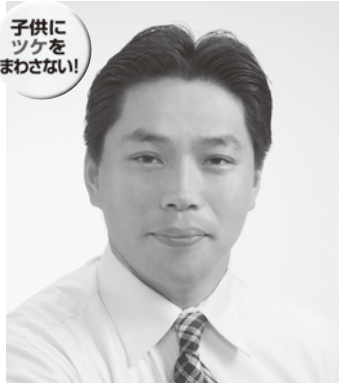
子供にツケをまわさない!

★皆様から沢山の年賀状ありがとうございました。議員(後援会)からの年賀状の配布は公職法により禁止されています。ご理解を。